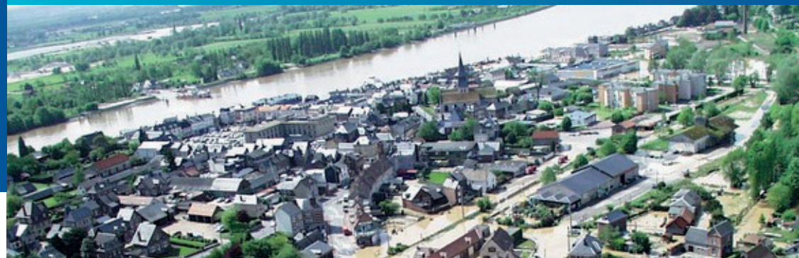
Inondations à Duclair en 2000