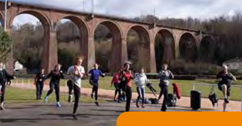
BODY FIT N'KOMBAT