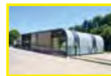
7 Boulodrome Rue Antoine Bourdelle