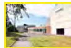
8 Complexe sportif la Viardière Rue Freckenhorst - Pavilly