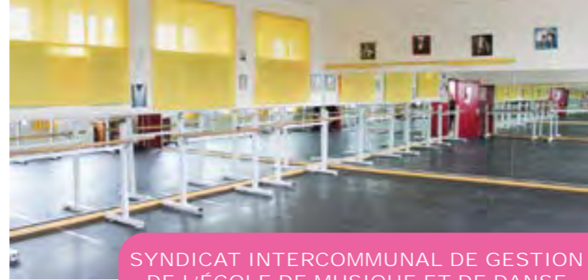
SYNDICAT INTERCOMMUNAL DE GESTION DE L'ÉCOLE DE MUSIQUE ET DE DANSE DU CANTON DE PAVILLY (SIGEMD)