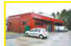
6 Salle Richard Queillé Rue du Professeur Alain