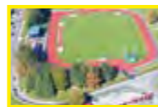
2 Complexe Joseph Guillemot Rue du 19 mars 1962