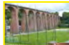
1 Complexe Georges Badin Rue Jean Jaurès