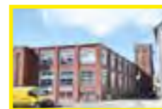
9 Salle du Cogétéma Allée du Cogétéma - Pavilly