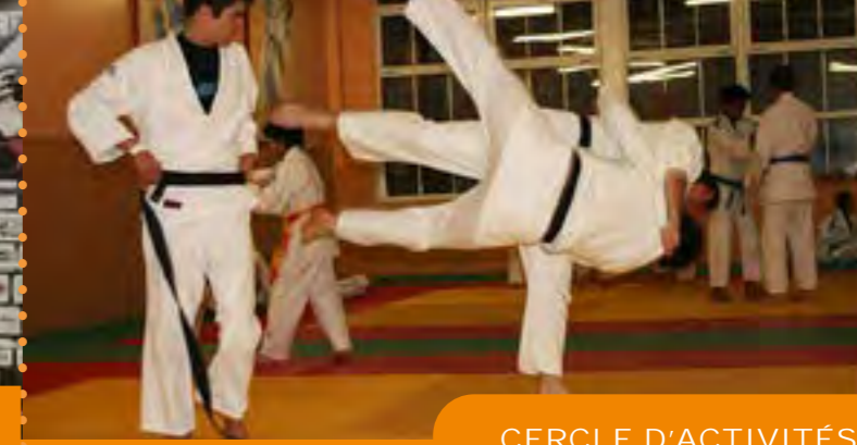
CERCLE D'ACTIVITÉS PHYSIQUES