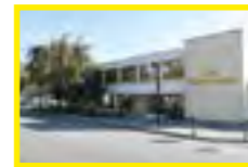
5 Salle Pierre de Coubertin Rue Jean Jaurès